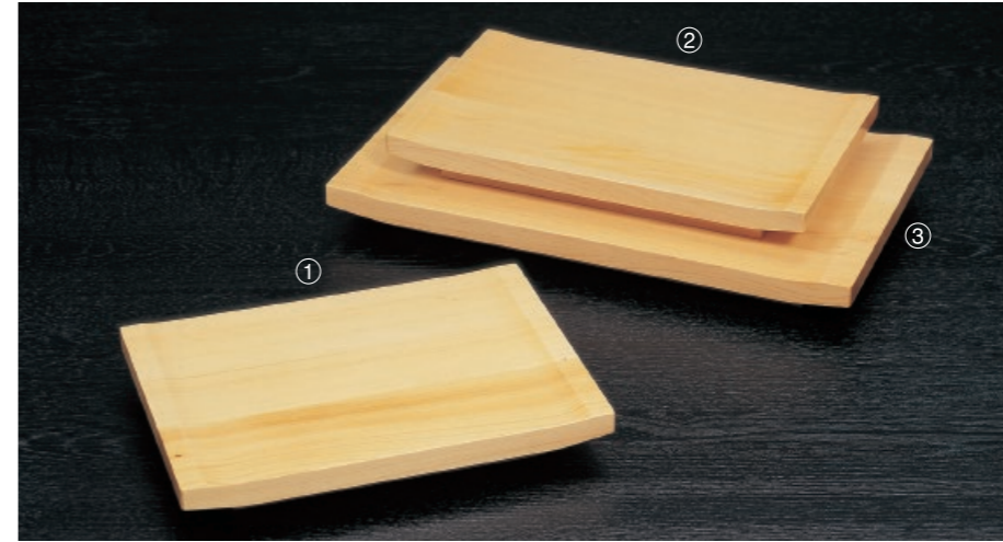
26-222-01 (52673) 檜L型無地盛皿(小) ¥2,800 本体寸法: W21xD15xH3cm 木/ウレタン塗装