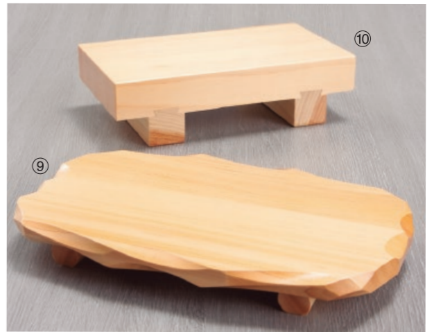
26-222-09 (521539) 檜彫刻盛台 ¥3,950 本体寸法: W24xD15xH3cm 木/ウレタン塗装