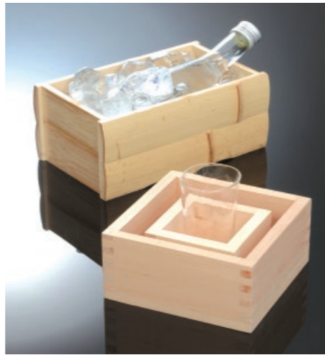
26-221-08 (289078) 冷酒ボックス(スス) ¥6,700 本体寸法: W21xD13xH10cm 竹/ウレタン塗装