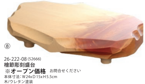
26-222-08 (52666) 檜彫刻盛台 ※オープン価格 お問合せください 本体寸法: W24xD15xH5.5cm 木/ウレタン塗装