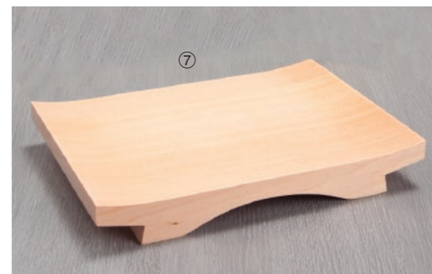
26-222-07 (521537) 檜反り天盛皿 ¥2,800 本体寸法: W21xD15xH3cm 木/ウレタン塗装