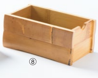
26-221-07 (289079) 冷酒ボックス(白) ¥6,700 本体寸法: W21xD13xH10cm 竹/ウレタン塗装