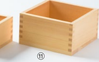
26-221-09 (52117) 1合枧 ¥650 本体寸法: W8.5xD8.5xH5.5cm 木