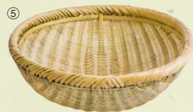
26-179-05 (31312) 青竹磨特大丸深籠 ¥17,500 本体寸法: Φ53xH15cm 竹