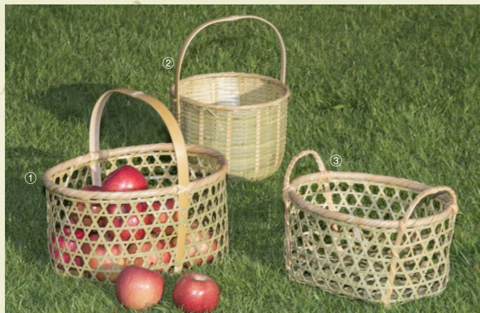
26-179-01 (31863) 里山収穫籠 ¥13,000 本体寸法: W34xD28xH32cm 竹