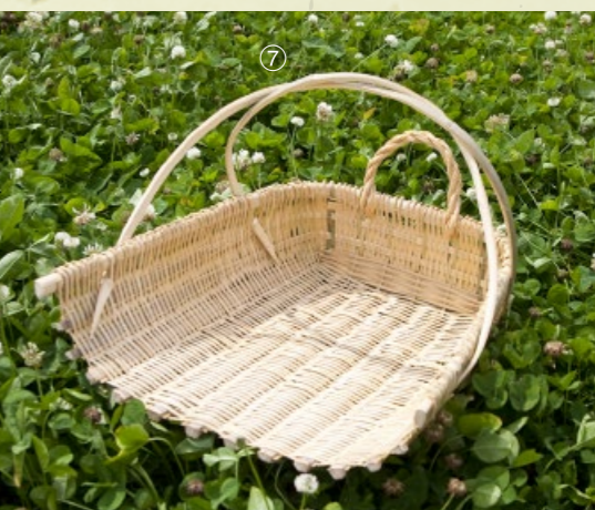
26-180-07 (423584) 手付箕 ¥11,000 本体寸法: W40xD41xH31/12cm 竹