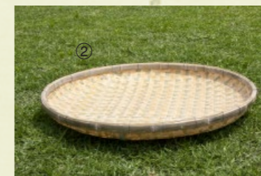
26-180-02 (423582) 茶葉用選別籠 干しザル(上) ¥30,000 本体寸法: Φ81xH10cm 竹