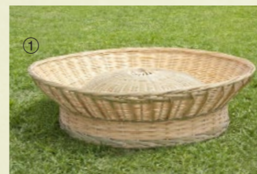
26-180-01 (423581) 茶葉用選別籠 ¥35,000 本体寸法: Φ88xH23cm 竹