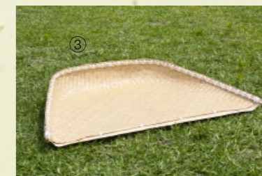
26-180-03 (423583) 茶葉用選別籠 茶葉用選別箕籠 ¥35,000 本体寸法: W87xD55xH12cm 竹