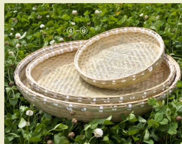
26-180-04 (423585) 青竹飾り掬丸籠(小) ¥26,000 本体寸法: Φ51xH7cm 竹