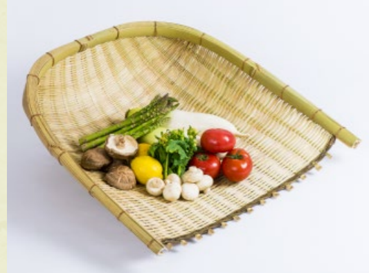
26-179-03 (31862) 里山収穫籠(耳付) ¥11,000 本体寸法: W35xD25xH21.5cm 竹