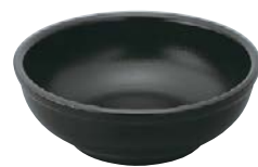
75121-078 ゆず黒 23cmボール 2,800円 (232×83mm)