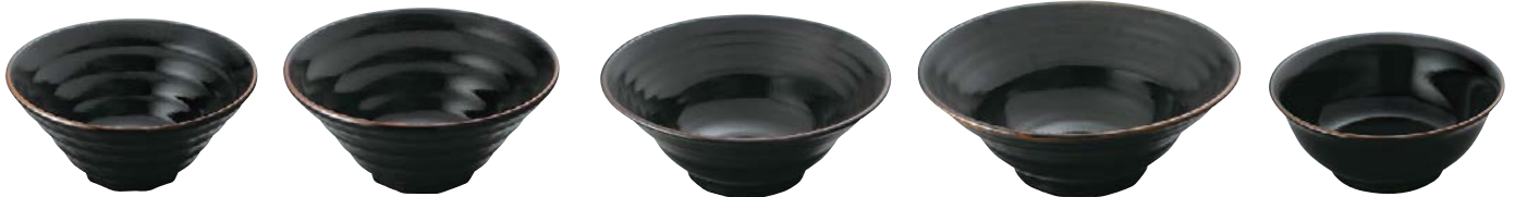
75219-118 鳴門6.5反井 1,650円 (200×89mm・1,100cc) 75220-118 鳴門7.0反井 1,870円 (215×95mm・1,450cc) 75221-118 六兵衛7.0丼 1,850円 (225×88mm・1,450cc) 75222-118 六兵衛8.0丼 2,420円 (250×94mm・1,900cc) 75223-118 6.3高台丼 1,030円 (185×78mm・1,000cc)