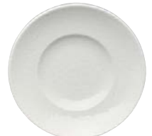
77364-028 受皿(白) 490円 (218×38mm)