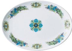
74808-178 10吋プラター 2,450円 (263×190×29mm)