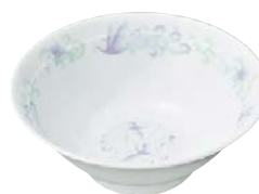
74713-178 6.5リムラーメン 1,800円 (197×80mm)