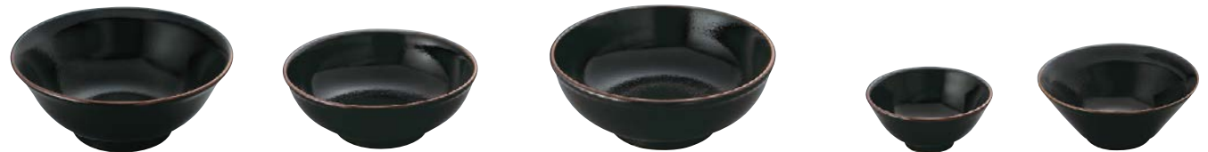
75224-118 6.8高台丼 1,240円 (212×87mm・1,360cc) 75225-118 6.0玉井 920円 (183×67mm・850cc) 75226-118 7.0玉井 1,300円 (213×80mm・1,520cc) 75227-118 3.6スープ碗 460円 (117×52mm) 75228-118 4.8ライス碗 660円 (150×62mm)