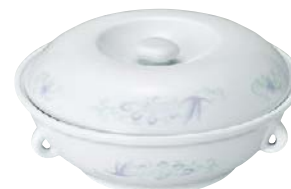
74723-178 11吋とんき 19,000円 (273×128mm・2,400cc)