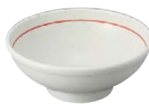
77376-028 6.8玉高台井 1,090円 (206×84mm)