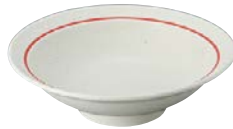
77362-028 7.0丸高台皿 1,080円 (220×68mm)