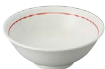
77372-028 6.5反高台井 890円 (195×77mm)