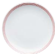
75702-118 7インチプレート 1,170円 (180×22mm)