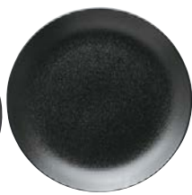
75105-078 ゆず黒 8吋メタ玉皿 980円 (212×27mm)