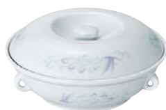
74721-178 9吋とんき 11,000円 (230×104mm・1,200cc)