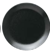
75103-078 ゆず黒 6½吋メタ玉皿 700円 (170×20mm)