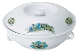
74819-178 9吋とんき 9,300円 (230×104mm・1,200cc)