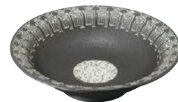
77965-028 6.0丸高台皿 670円 (187×54mm)