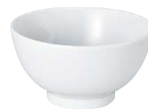
75515-088 丸菓子碗 1,100円 (128×68mm)