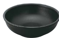
75120-078 ゆず黒 20cmボール 1,700円 (200×70mm)