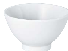
75514-088 大茶碗 1,050円 (135×76mm)