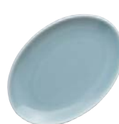
75132-078 青磁 7吋プラター 900円 (190×137×18mm)