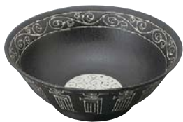
77961-028 6.3ラーメン丼 800円 (193×72mm)