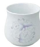
74740-178 ガラ入れ(大) 3,300円 (115×120mm)