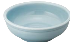
75144-078 青磁 23cmボール 2,800円 (232×83mm)