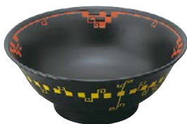
77932-028 6.8ラーメン丼 1,090円 (215×88mm)