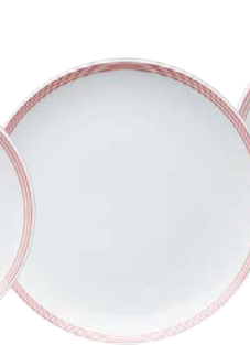
75705-118 10インチプレート 2,480円 (265×30mm)