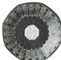
77967-028 八角シューマイ皿 730円 (187×185×54mm)