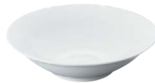
75625-118 8.5寸浅口丼 2,680円 (258×71mm)