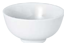
75516-088 厚口3.8南京丼 600円 (117×60mm)