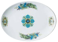
74806-178 8吋プラター 1,650円 (210×151×24mm)