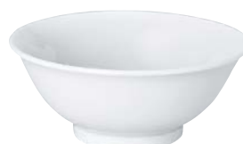
75510-088 ミニ反井 1,070円 (174×74mm)