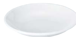
75506-088 白玉4.5取皿 450円 (142×20mm)