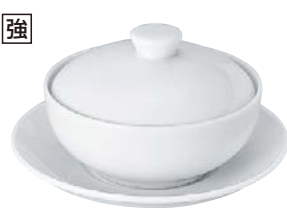
強 75524-088 手無フカヒレ 1,700円 (116×72mm) 75525-088 フカヒレ用受皿 620円 (150×23mm)