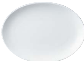
75612-118 10インチオーバルプレート 1,370円 (262×191×28mm)