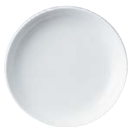
75607-118 6インチ深口プレート 650円 (169×26mm)