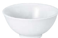
75518-088 厚口3.4スープ碗 500円 (107×50mm)