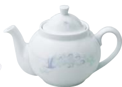
74735-178 丸土瓶 7,200円 (145mm・900cc)