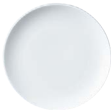
75603-118 8インチプレート 740円 (204×23mm)