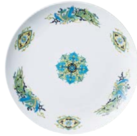
74804-178 10吋丸皿 2,900円 (261×31mm)