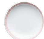
75709-118 取皿 830円 (130×23mm)