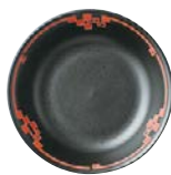
77933-028 4.0取皿 370円 (141×33mm)