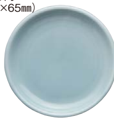
75130-078 青磁 23cm皿 1,600円 (232×30mm)