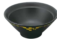
77935-028 ライス丼 580円 (150×65mm)