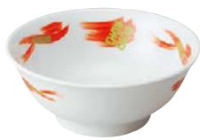
77701-188 高台6.5井 1,950円 (200×83mm)