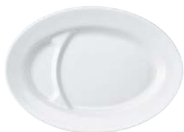
75507-088 9吋仕切小判皿 1,250円 (226×164×24mm) 75508-088 8吋仕切小判皿 830円 (210×150×20mm)