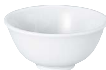
75519-088 厚口3.6スープ碗 530円 (114×58mm)