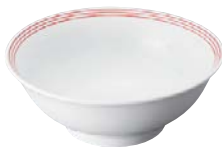
75716-118 7寸反井 1,980円 (97×53mm)