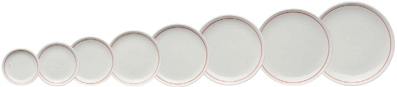
77351-028 5吋丸皿 370円 (125×22mm)