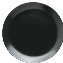
75106-078 ゆず黒 9吋メタ玉皿 1,300円 (240×29mm)