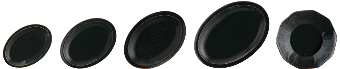
75209-118 8吋プラター 920円 (210×146×26mm) 75210-118 9吋プラター 1,130円 (235×170×26mm) 75211-118 10吋プラター 1,320円 (260×190×29mm) 75212-118 12吋プラター 2,640円 (316×224×30mm) 75213-118 十角7.5皿 1,030円 (230×30mm)