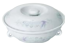
74720-178 8吋とんき 7,700円 (207×93mm・880cc)