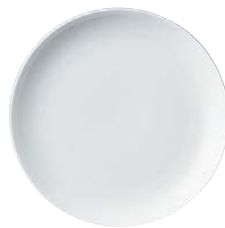
75609-118 9インチ深口プレート 1,010円 (239×29mm)