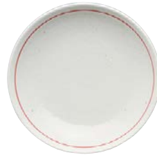
77363-028 8.0めん皿 860円 (244×50mm)