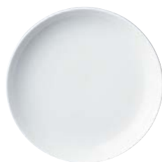
75608-118 8インチ深口プレート 910円 (216×28mm)