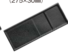
75114-078 ゆず黒 スタック取皿付2連皿 1,700円 (225×85×20mm)