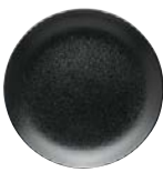
75102-078 ゆず黒 6吋メタ玉皿 630円 (155×18mm)