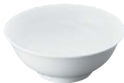
75623-118 6.5寸反井 1,160円 (200×79mm)