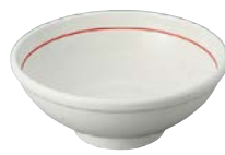
77375-028 6.5玉高台井 930円 (195×80mm)