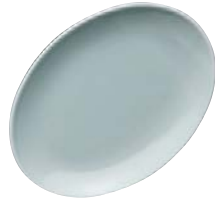
75134-078 青磁 9吋プラター 1,400円 (240×170×27mm)