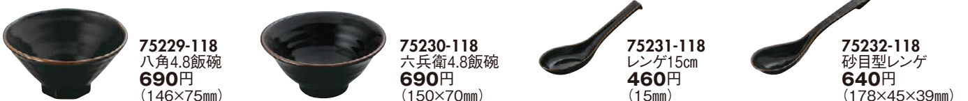
75229-118 八角4.8飯碗 690円 (146×75mm) 75230-118 六兵衛4.8飯碗 690円 (150×70mm) 75231-118 レンゲ15cm 460円 (15mm) 75232-118 砂目型レンゲ 640円 (178×45×39mm)