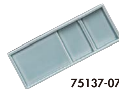
75137-078 青磁 スタック取皿付2連皿 1,600円 (225×85×20mm)