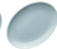
75133-078 青磁 8吋プラター 1,100円 (212×150×24mm)