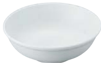
77303-088 6.5玉井 2,000円 (197×68mm)