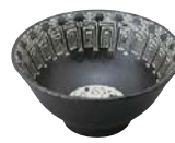
77964-028 3.6スープ碗 440円 (118×55mm)