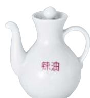
75532-088 カスター辣油 1,700円 (125cc)