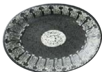
77966-028 6.5小判皿 980円 (190×135×22mm)