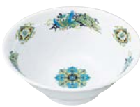
74817-178 6.5リムラーメン 1,750円 (197×80mm)