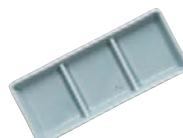
75136-078 青磁 スタック3連皿 1,200円 (180×73×24mm)