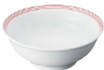
75715-118 6.5寸反井 1,770円 (200×79mm)