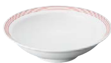
75714-118 7寸丸高台 2,000円 (212×59mm)