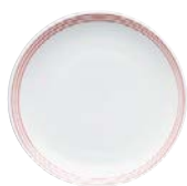
75701-118 6インチプレート 900円 (162×22mm)