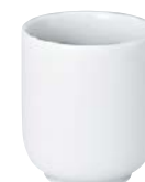
75528-088 マル五2.0長湯呑 290円 (66×75mm)