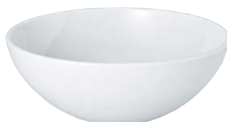
75513-088 6.5ボール 1,750円 (200×72mm)