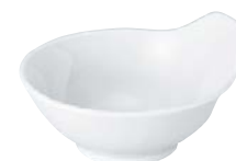
75529-088 とんすい 950円 (125×115×64mm)