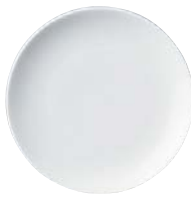
75602-118 7インチプレート 590円 (180×22mm)