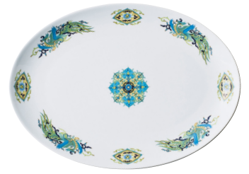
74810-178 14吋プラター 6,500円 (361×265×39mm)