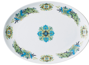
74809-178 12吋プラター 3,900円 (315×225×35mm)