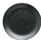
75101-078 ゆず黒 5½吋メタ玉皿 580円 (132×18mm)