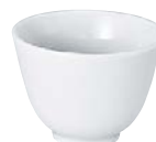
75527-088 リン煎茶 460円 (72×53mm)