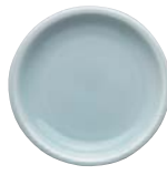
75128-078 青磁 15.5cm皿 850円 (155×25mm)