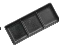
75113-078 ゆず黒 スタック3連皿 1,300円 (180×73×24mm)