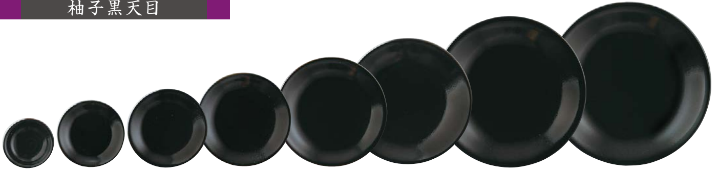
75201-118 3.0皿 400円 (95×24mm) 75202-118 4.0皿 440円 (129×22mm) 75203-118 4.5皿 500円 (150×22mm) 75204-118 5.5皿 660円 (180×26mm) 75205-118 6.5皿 930円 (210×31mm) 75206-118 7.5皿 1,300円 (237×34mm) 75207-118 9.0皿 2,640円 (285×37mm) 75208-118 尺皿 3,960円 (308×41mm)