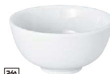
強 75521-088 11.3cm飯碗 620円 (113×59mm)