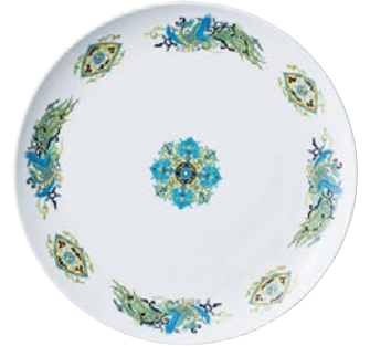
74805-178 12吋丸皿 5,500円 (307×36mm)