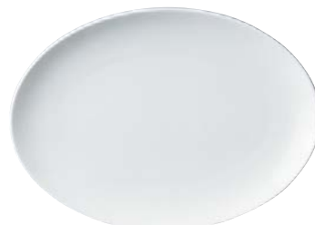
75613-118 12インチオーバルプレート 2,000円 (323×236×32mm)