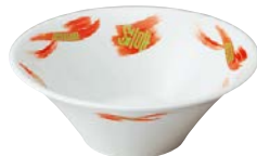
77710-188 7.0反井 2,080円 (210×80mm)