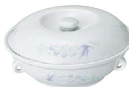
74722-178 10吋とんき 14,800円 (257×120mm・1,600cc)