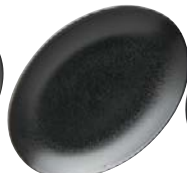
75109-078 ゆず黒 8吋プラター 1,200円 (212×150×24mm)