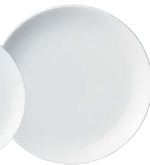
75606-118 12インチプレート 2,600円 (307×39mm)