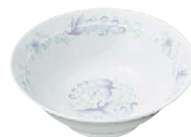
74714-178 7.0リムラーメン 2,900円 (215×83mm)