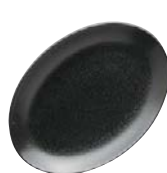
75108-078 ゆず黒 7吋プラター 900円 (190×137×18mm)