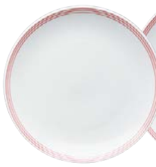
75704-118 9インチプレート 1,800円 (233×27mm)