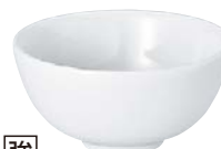
強 75520-088 10.7cm飯碗 590円 (107×53mm)