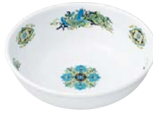
74815-178 6.5玉井 2,500円 (192×73mm)