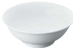
75624-118 7寸反井 1,240円 (217×82mm)