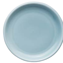
75131-078 青磁 26cm皿 2,100円 (260×32mm)