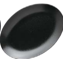
75110-078 ゆず黒 9吋プラター 1,500円 (240×170×27mm)