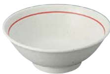
77374-028 7.0反高台井 1,100円 (215×86mm)