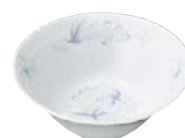
74730-178 4.8ライス井 1,750円 (148×62mm)