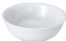
75517-088 3.8スープ取鉢 560円 (115×41mm)