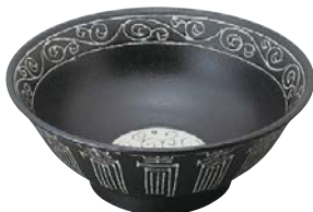
77962-028 6.8ラーメン丼 1,090円 (213×88mm)