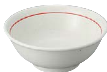
77373-028 6.8反高台井 1,020円 (202×83mm)