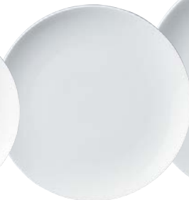
75605-118 10インチプレート 1,240円 (265×30mm)