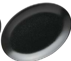
75111-078 ゆず黒 10吋プラター 1,800円 (265×190×30mm)