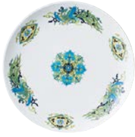
74801-178 7½吋丸皿 1,380円 (190×23mm)