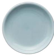
75129-078 青磁 19.5cm皿 1,100円 (198×29mm)