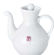
75530-088 カスター酢 1,700円 (125cc)