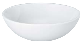
75512-088 5.0ボール 1,150円 (160×52mm)