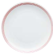
75703-118 8インチプレート 1,450円 (204×23mm)