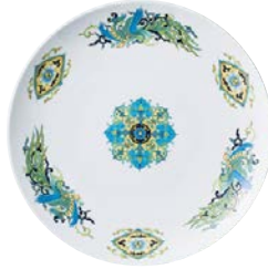
74803-178 9吋丸皿 1,750円 (237×27mm)