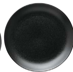
75107-078 ゆず黒 11吋メタ玉皿 1,900円 (275×30mm)