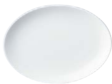
75610-118 8インチオーバルプレート 1,010円 (206×151×22mm)