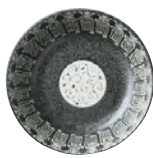
77963-028 4.0取皿 360円 (140×33mm)