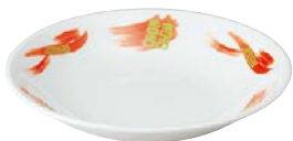
77709-188 8.0フカヒレ 1,800円 (239×45mm)