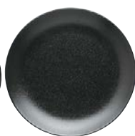
75104-078 ゆず黒 7吋メタ玉皿 850円 (195×23mm)