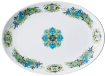
74807-178 9吋プラター 2,000円 (238×173×26mm)