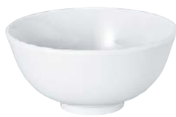
75509-088 台湾ラーメン丼 1,050円 (153×73mm)