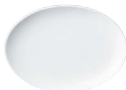
75611-118 9インチオーバルプレート 1,250円 (234×171×23mm)