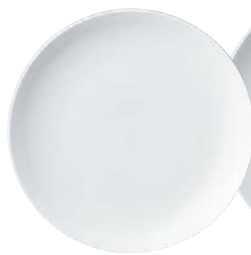
75604-118 9インチプレート 900円 (233×27mm)