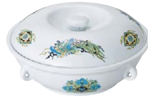
74820-178 10吋とんき 13,000円 (257×120mm・1,600cc)