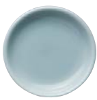
75127-078 青磁 14cm皿 750円 (140×23mm)