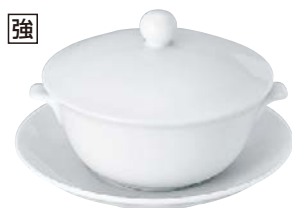
強 75522-088 手付フカヒレ 1,900円 (142×118×88mm) 75523-088 フカヒレ用受皿 620円 (150×23mm)