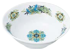
74818-178 7.0リムラーメン 2,400円 (215×83mm)