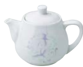
74736-178 ティーポット 4,600円 (110mm・450cc)