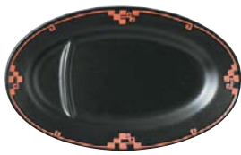
77937-028 10吋仕切付プラター 1,430円 (250×154×23mm)