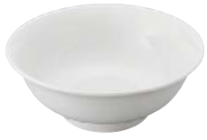
77301-088 7.0丸反井 2,150円 (217×83mm)