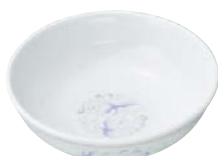
74716-178 6.0玉井 2,100円 (176×64mm)