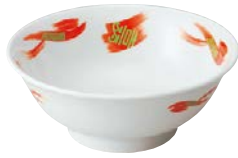
77702-188 高台6.8井 2,050円 (212×84mm)