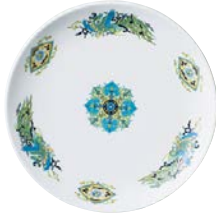
74802-178 8吋丸皿 1,600円 (210×27mm)