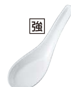
強 75535-088 強化レンゲ 580円 (150×45mm)