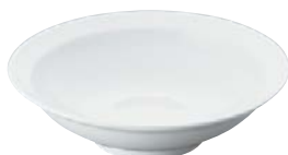
75622-118 7寸丸高台 1,370円 (212×59mm)