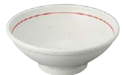
77377-028 7.0玉高台井 1,180円 (218×89mm)