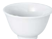
75526-088 2号反煎茶 460円 (95×56mm)