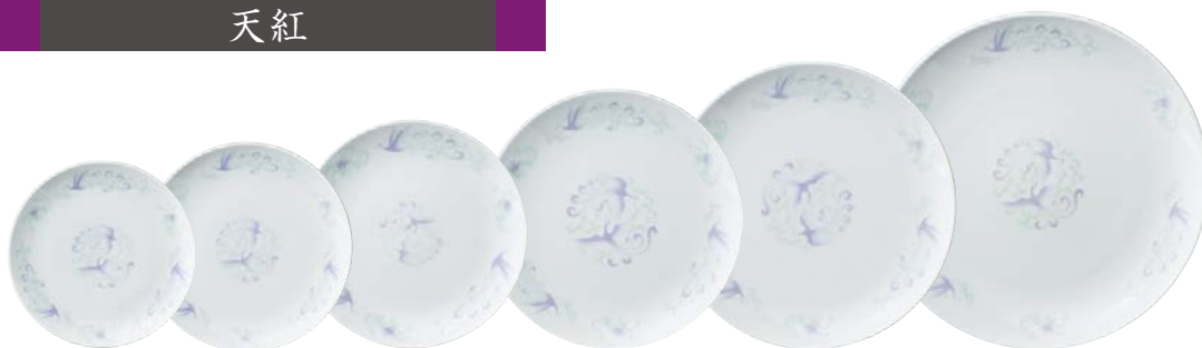
74701-178 6½吋丸皿 1,050円 (170×23mm) 74702-178 7½吋丸皿 1,230円 (190×23mm) 74703-178 8吋丸皿 1,650円 (210×27mm) 74704-178 9吋丸皿 1,850円 (237×27mm) 74705-178 10吋丸皿 2,850円 (261×31mm) 74706-178 12吋丸皿 5,650円 (307×36mm)