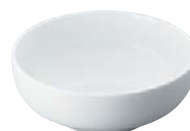
75630-118 丸スープボール大 880円 (158×59mm)