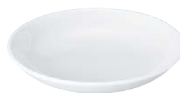
75505-088 白4.3取皿 350円 (137×27mm)