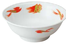
77703-188 高台7.5井 3,380円 (232×90mm)