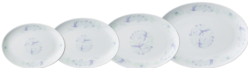
74709-178 8吋プラター 1,650円 (210×151×24mm) 74710-178 9吋プラター 2,050円 (238×173×26mm) 74711-178 10吋プラター 2,450円 (263×190×29mm) 74712-178 12吋プラター 3,800円 (315×225×35mm)