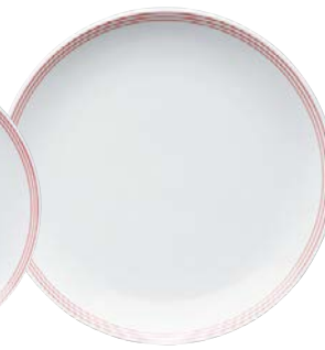
75706-118 12インチプレート 4,430円 (307×39mm)