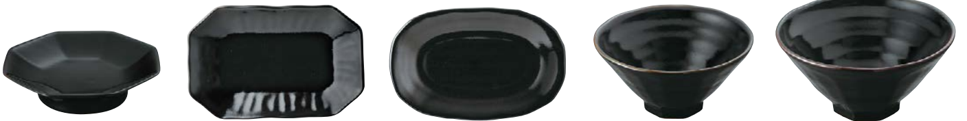
75214-118 八角シュウマイ 1,060円 (183×43mm) 75215-118 八角多用皿 1,260円 (240×155×28mm) 75216-118 六兵衛型多用皿 1,260円 (242×160×25mm) 75217-118 八角6.3丼 1,650円 (190×97mm・1,160cc) 75218-118 八角7.0丼 2,300円 (220×114mm・1,700cc)