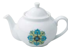
74828-178 ティーポット 7,200円 (145mm・900cc)