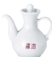
75531-088 カスター醤油 1,700円 (125cc)