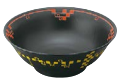
77931-028 6.3ラーメン丼 800円 (192×70mm)