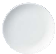
75601-118 6インチプレート 420円 (162×22mm)