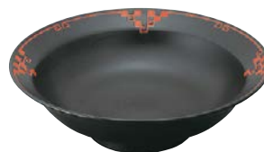
77939-028 8.0丸高台鉢 1,870円 (240×75mm)