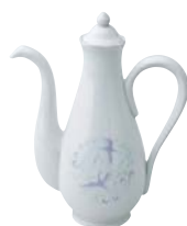
74733-178 老酒ポット 4,950円 (93mm・300cc)